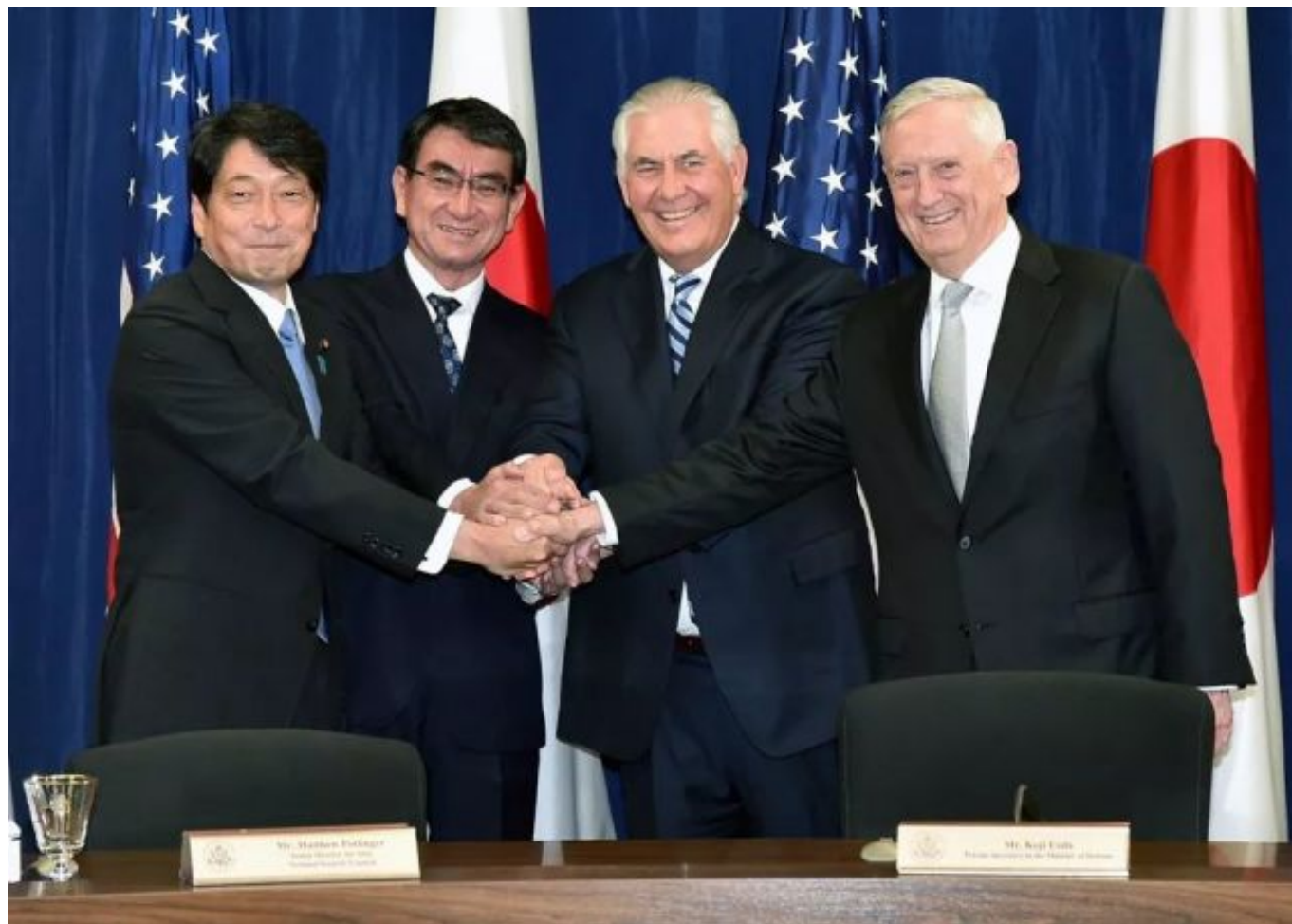
▲ 资料图片：2017年8月15日，美日外长和防长“2+2”会谈在华盛顿举行。（日本外务省）

另据日本《朝日新闻》10月31日报道称，近日，日美两国政府开始讨论在冲绳美军基地汉森军营部署陆上自卫队的离岛专守部队。