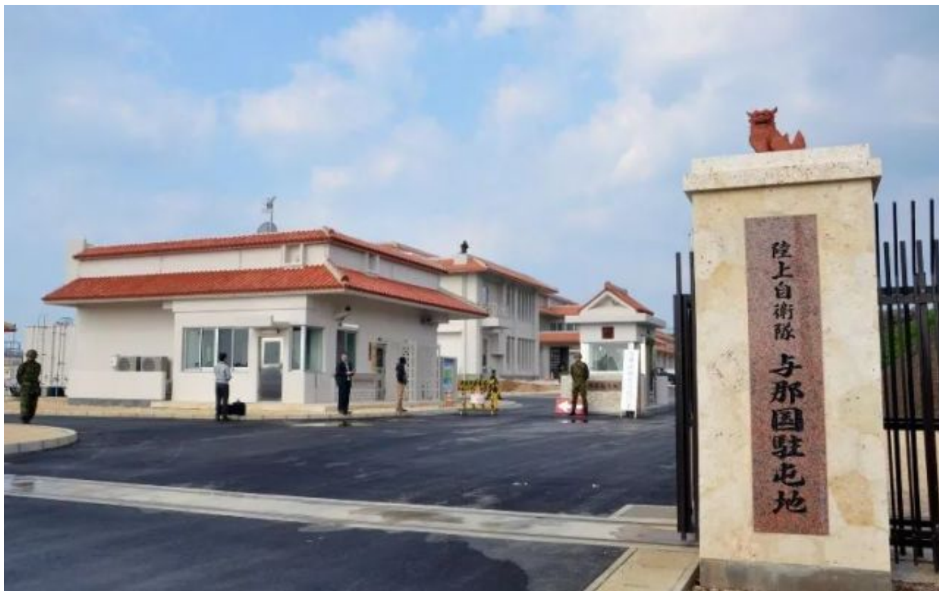
▲ 资料图片：2016年3月28日，日本陆上自卫队在与那国岛部署了沿岸监视部队，以强化西南部防御。（日本《每日新闻》）

日美两国政府2006年就转移驻冲绳美海军陆战队至关岛和返还冲绳县中南部美军基地达成协议，其目的就是减轻冲绳过重的美军基地负担。当时参与日美谈判的防卫省官员说，“虽然需要继续减轻冲绳的基地负担，但当时没有考虑到中国在这里进行海洋活动”。