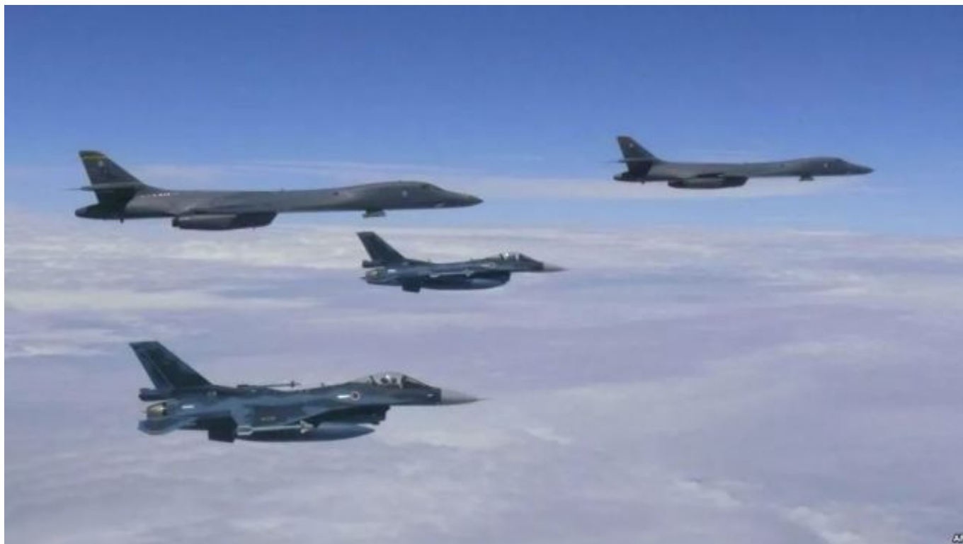
▲ 资料图片：2017年8月8日，美国空军和日本航空自卫队在朝鲜半岛附近空域进行了共同训练，图为参加训练的美国超音速战略轰炸机B1-B和日本航空自卫队的F-2战斗机。

然而，日本防卫省的官员称，“从快速反应角度看，驻留在冲绳本岛的话绝对更迅速”。关于在汉森军营设置水陆机动联队的理由，防卫省内部有人称，“因为是共同使用美军的设施，所以不需要增加新的基地”。